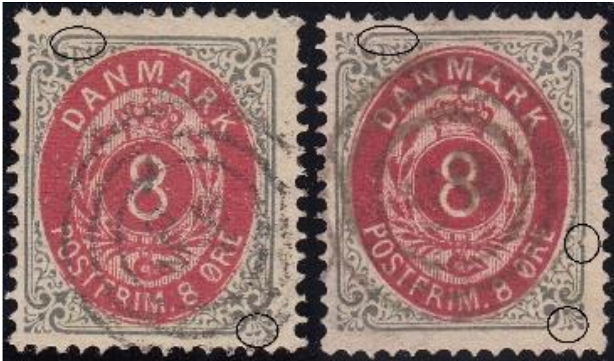
8ø8 A30 uden RF Ø