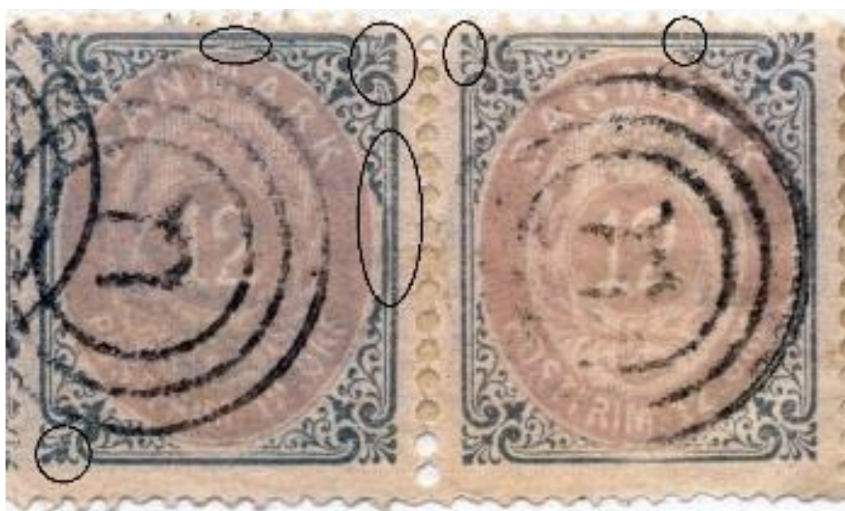
12ø4 22 med RF NØ