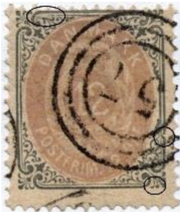
12ø4 30 med RF Ø (Schäffer-samling)

For vi kender mærker fra 12ø4 med fejlen på rammelinien, betyder det for trykrækkefølgen i 1877 serien, at 8ø8 (eller for mindst en del af oplaget) blev trykt før 12ø4!?