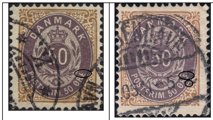
50ø12 pos. 44