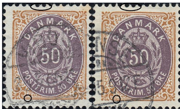
50ø12-13 pos. 33 (uden OF)