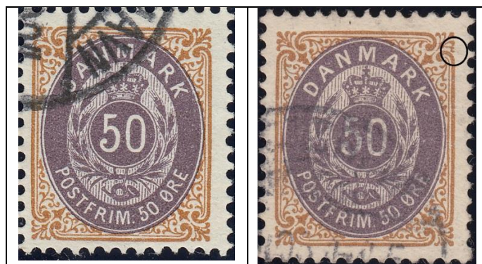
50ø12 pos. 48