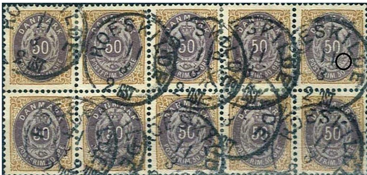
50ø12 pos. 42-46, 52-56 (OF.7 på pos. 46)

PS (10.09.2017): Her er den uskarpt skanning af tiblokken: