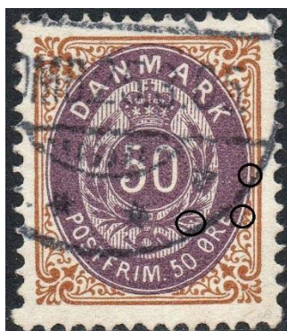
50ø12-13 pos. ? (=> 50ø13 pos. 47 – se PS næste side)