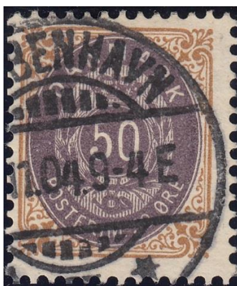
50ø13 pos. 100 omv. rm.

Den tidligst kendte afstempling af tryk 13 (med takning KIX) er fra november 1904: