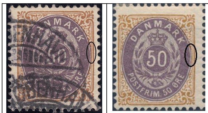
50ø12 pos. 32

(ny OF: tynd og let indtrykket ovallinie i øst lidt over midten - se også 50ø11 pos. 37 og 50ø14 pos. 73, hvor endda en lille del af ovallinien mangler)