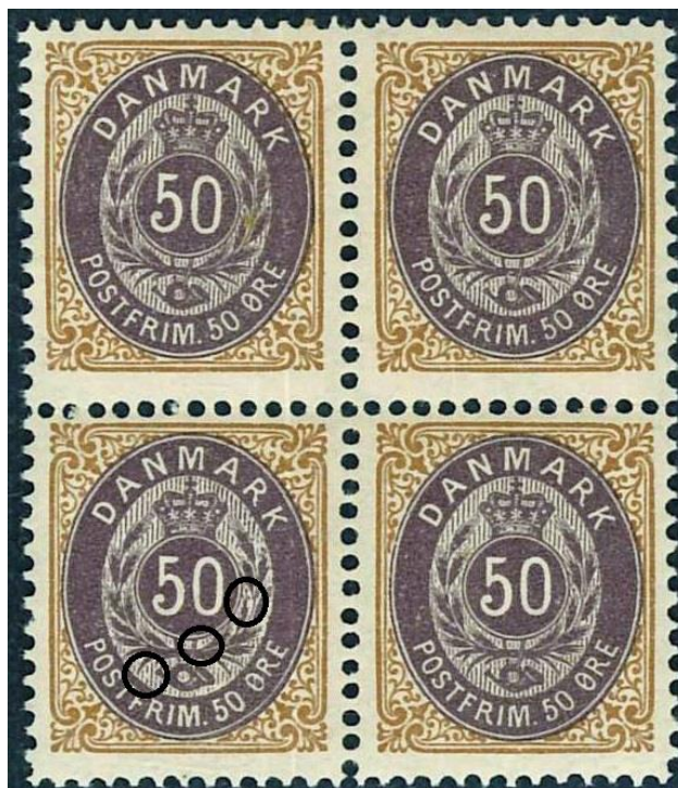
50ø12-13 pos. 23-24, 33 (OF.4) - 34

(Men der startede ingen diskussion...?!)