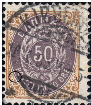
50ø13 pos. 17 (OF.70)

50ø12-13 pos. 17 har en lille ovalfejl (OF.70): små bule / hak på ovallinien under O i POST. Se også 50ø14 pos. 34: