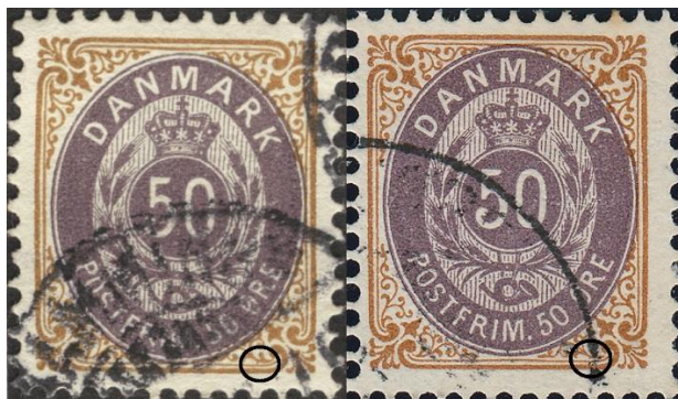
50ø12 pos. 30

50ø12-13 pos. 30 har en ramme-kendetegn: små farveplet under grenornament SSØ. Ses også (antydningvis) i helark 3ø24: