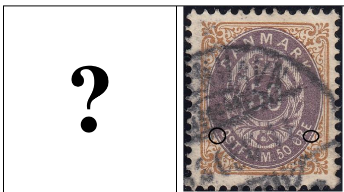
OF.29 er ikke registreret i 50ø12 indtil nu.

(ekstra kendetegn: farveplet mellem ovalbånd og ovallinie under O i POST, se også 50ø14 pos. 17)