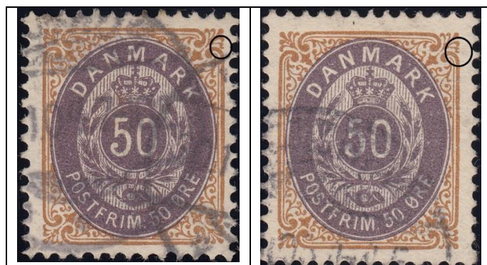
50ø12 pos. 49

Her for sammenligning pos. 49 fra tryk 12 og 13: