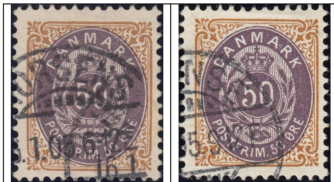
50Ø12 pos. 27