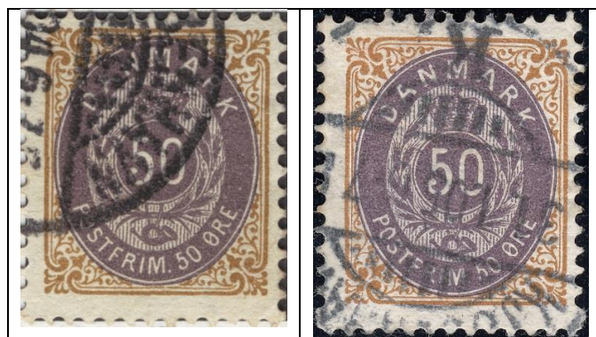
50ø12 pos. 45