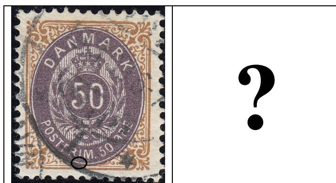
50ø12 pos. 47

5) OF.62 47 ? (september 2017) (ny OF: farveplet mellem ovalbånd og ovallinie under I i FRIM, se også 50ø14 pos. 13)