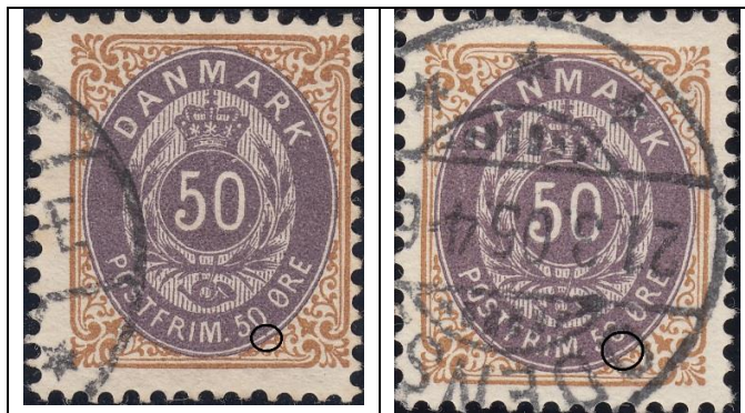
50ø12 pos. 29

(ny OF: lille farveplet mellem ovalbånd og ovallinien under 0 i 50 - se også 50ø14 pos. 27):