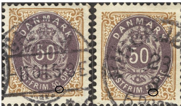
50ø12 pos. 21

50ø12-13 pos. 21 har en lille oval-kendetegn (ny OF?): små farveplet mellem ovalbånd og ovallinien under O i 50 - ligner OF.69 (se side 12), men sidder lidt mere til venstre. Jeg kender kun disse to eksemplarer og har ikke fundet fejlen i 50ø14: