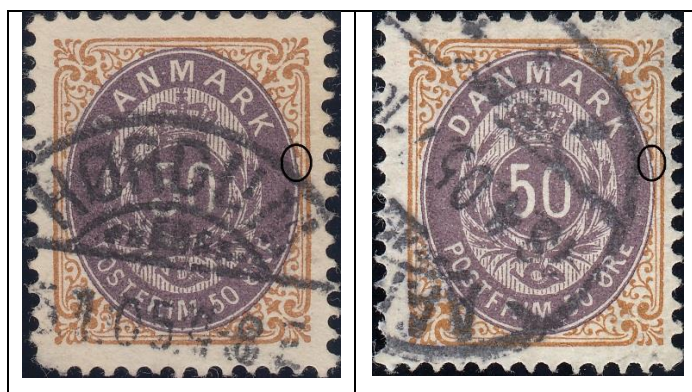
50ø12 pos. 35