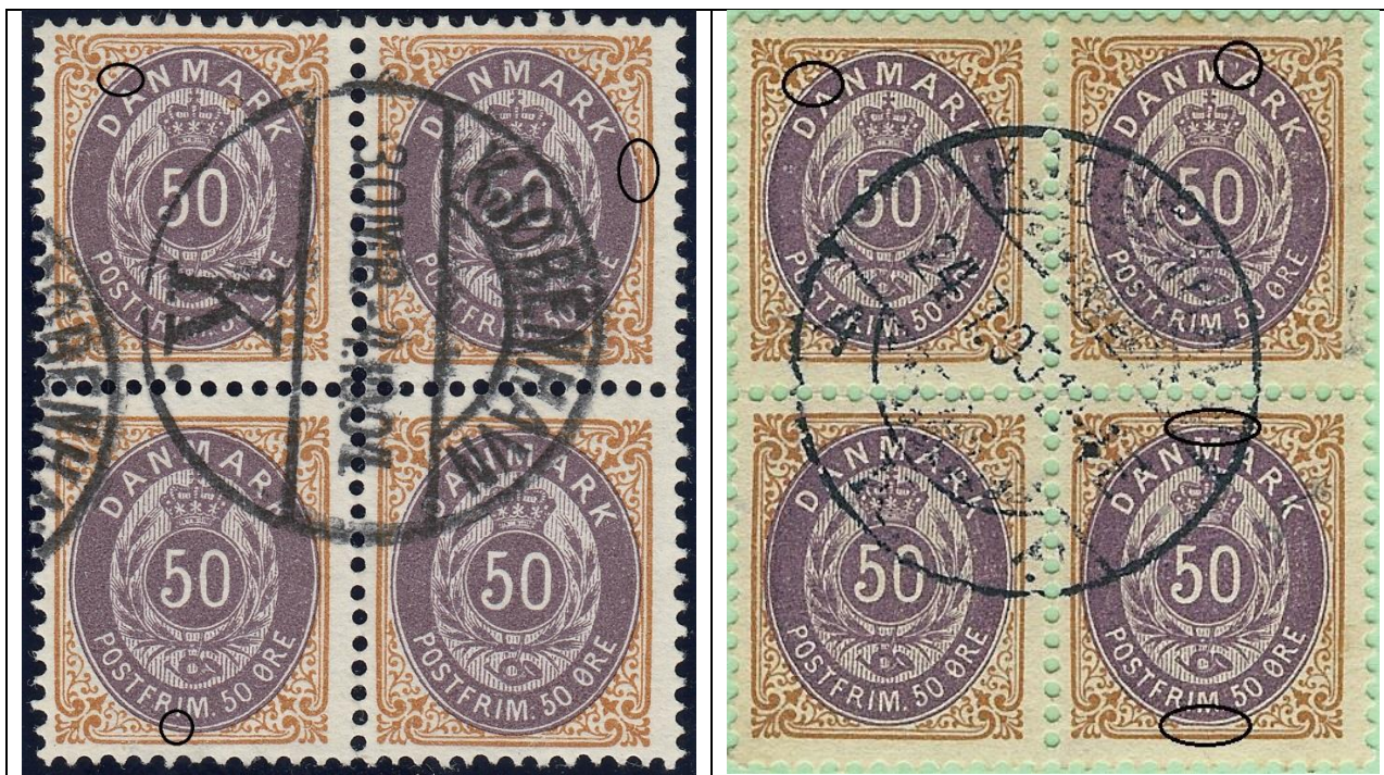
50ø12 pos. 37 (OF.12) – 38 (OF.24) 47 (OF.62) – 48