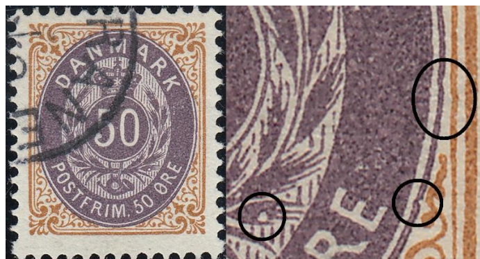
50ø12-13 pos. ? (=> 50ø13 pos. 47 – se PS side 10)