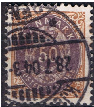
50ø12 pos. 66

- altså før afleveringen af 50ø13 (30.7.04):