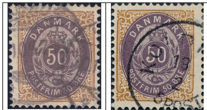
50ø12 pos. 49