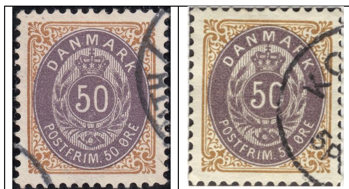
50ø12 pos. 31