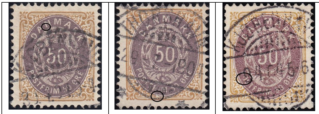
OF.14 50ø11 pos. 53(?)

OF – placeringer med (et lille) spørgsmålstegn (jeg er temmelig sikker, men vil gerne have bekræftet positionerne med parstykker eller enheder):