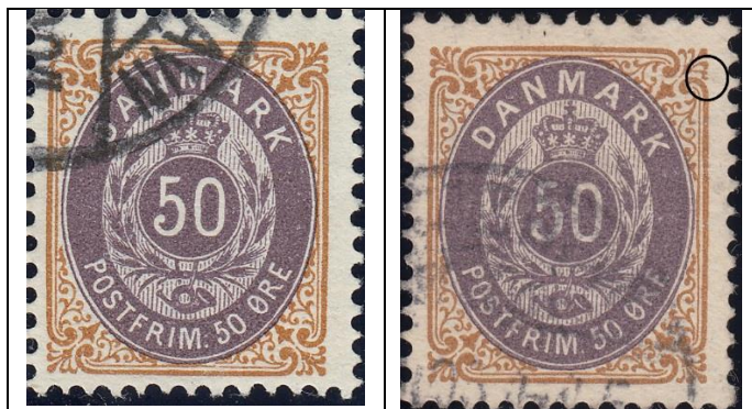
50ø12 pos. 48