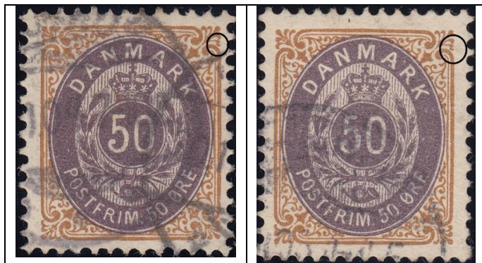
50ø12 pos. 49

Her for sammenligning pos. 49 fra tryk 12 og 13: